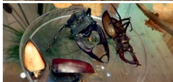
Oben: In geschützten Arealen kann die Natur sich innerhalb unserer Wirtschaftswälder nach ihren eigenen Regeln entfalten. Mitte: Inschrift am 1871 erbauten Forsthaus Curtius im Duisburger Stadtwald. Darunter: Hirschkäferpanzer im Museum „Eiskeller“ in Wesel-Diersfordt, nahe beim Diersfordter Wald. Ganz unten: Kaiser Otto III. wurde 980 im Klever Reichswald geboren.