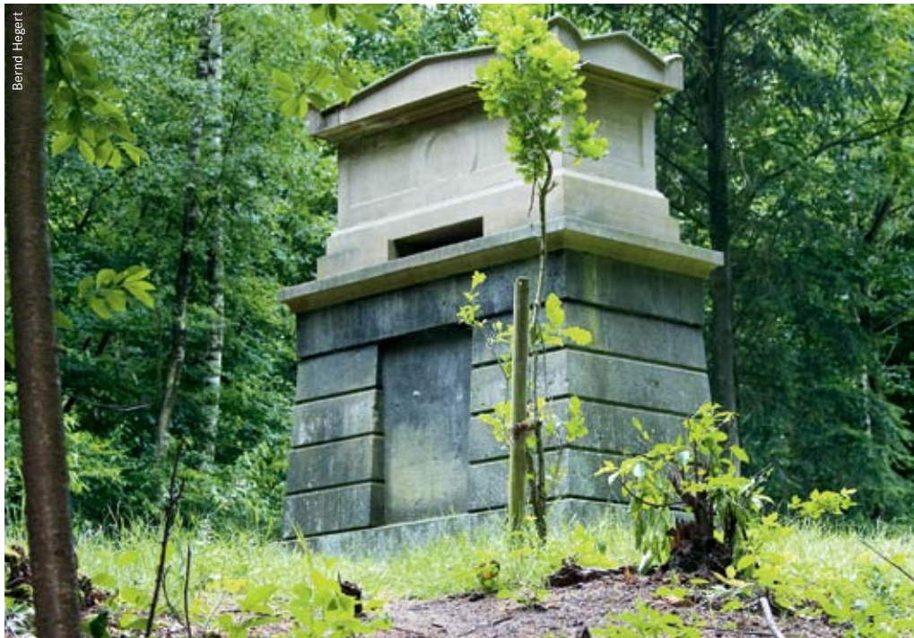
Oben: Eins der eindrucksvollen Grabmäler der Adelsfamilie von Wylich im Diersfordter Wald. Das Projekt möchte die Augen der Wanderer aber auch dafür schärfen, dass die Vegetation selbst ein Zeuge der Geschichte sein kann: Die Wechselwirkung von Mensch und Natur prägt oft noch nach Jahrhunderten charakteristische Waldbilder.